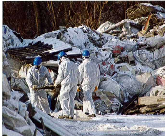
Seit November laufen die Sanierungsarbeiten bei der ehemaligen Asbest-Entsorgungsanlage Hockenheim; in vielen Punkten werden die Ausschreibungsbestimmungen missachtet.