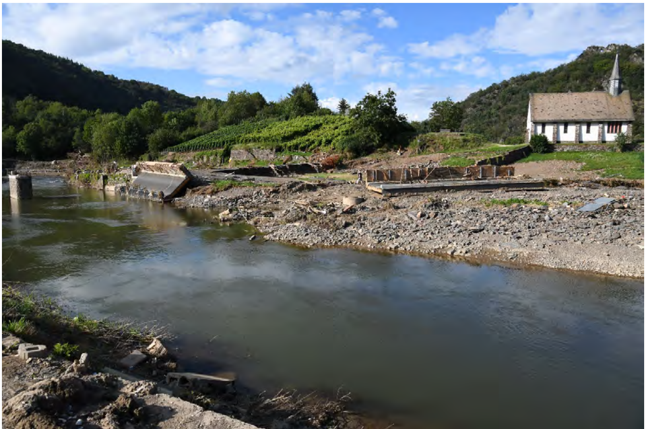
Durch die Flut zerstörte Brücke im Ortsteil Altenahr-Altenburg

So waren zum Beispiel viele Wohn- und Geschäftsimmobilien in den vom Hochwasser betroffenen Gebieten plötzlich ohne Wärmeversorgung. Auch zahlreiche Flüssiggastanks wurden von der Flut mitgerissen oder beschädigt. Daher mussten Sonderprüfungen an den sicherheitsrelevanten Einrichtungen initiiert werden. Zur Erarbeitung eines Schutzkonzeptes wurde seitens des Flüssiggasverbandes (Deutscher Verband Flüssiggas e. V.) eine Task Force eingerichtet, die sich mit einer abgestimmten Vorgehensweise zur schnellen, aber auch zukunftssicheren Wiederherstellung der Versorgung in den vom Hochwasser betroffenen Gebieten beschäftigte. Das Schutzkonzept wurde mit der Gewerbeaufsicht abgestimmt.