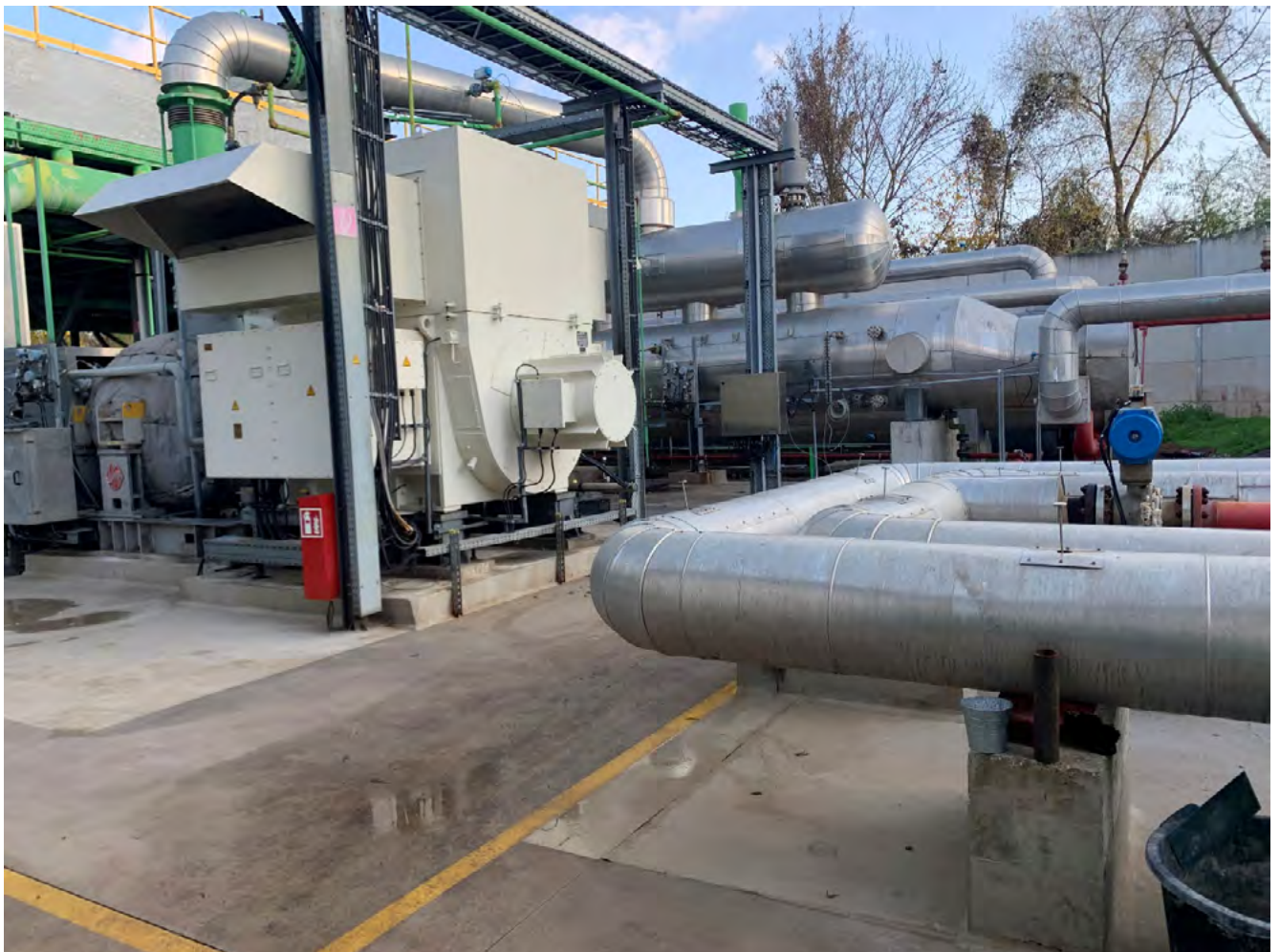
Dampfturbine mit Stromgenerator der Geothermieanlage der Fa. GEOX in Landau

Je nach Tiefenlage zwischen 2.000 m bis 7.000 m liegen hier Thermalwassertemperaturen von 80 °C bis 160 °C vor, was ein enormes Energiepotenzial birgt. Das Thermalwasser im Oberrheingraben weist zudem einen recht hohen Lithiumgehalt von durchschnittlich 180 mg/l auf.